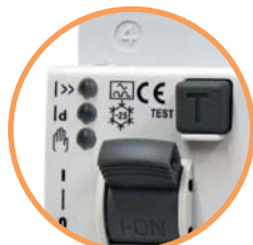
KZS EDI - "ON" Включен (индикация отсутствует)