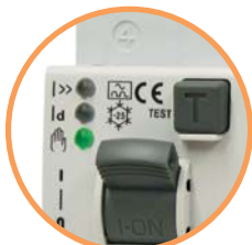
KZS EDI - "OFF" Отключен вручную (горит зеленый LED)