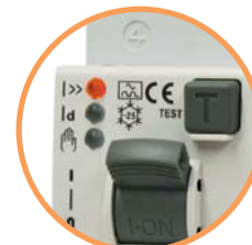
KZS EDI - "OFF" Отключен от срабатывания тепловой или электромагнитной защиты (горит красный LED)