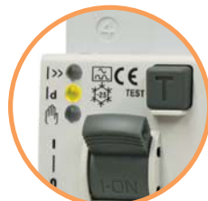
KZS EDI - "OFF" Отключен от срабатывания диф. защиты (горит желтый LED)