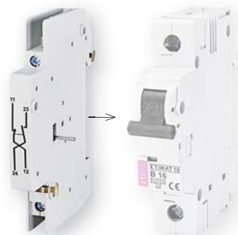
PS ETIMAT 10