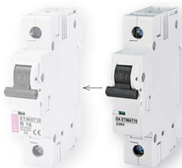
DA ETIMAT 10

Описание: Заглушка клемм служит для закрытия клемм автоматических выключателей серии ETIMAT 6, ETIMAT 10 (0,5-63A), ETIMAT 10 DC.